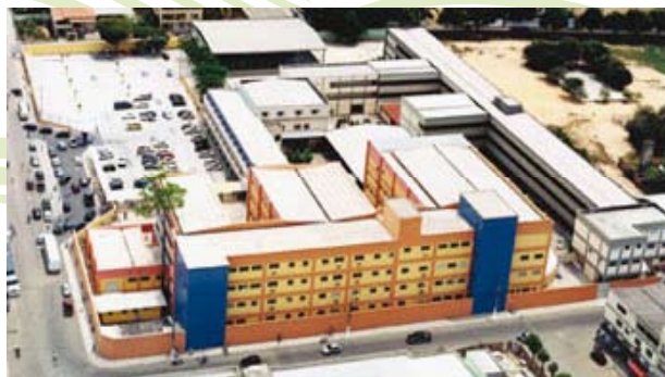
Faculdade UNILINHARES - Linhares / ES

A Kroton Educacional S.A. comunica a aquisição de 100% da Sociedade Capixaba de Educação LTDA, Faculdade UNILINHARES, localizada na cidade de Linhares, estado do Espírito Santo.